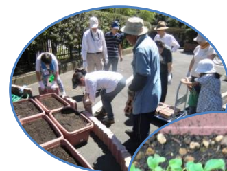
▲暑かった日の土壌づくり