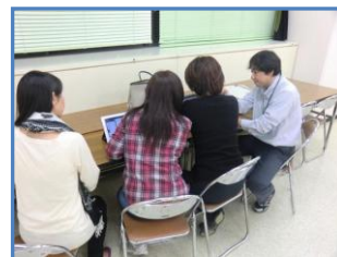
★毎月のサロンの様子（左）

毎月開催しているSNSサロンですが、皆さまSNSはご存知でしょうか？SNSとは、人と人とのつながりを促進・サポートするコミュニティ型のWebサイトのことです。SNSサロンではFacebookを中心に使い、アカウント作成、実際の使い方など、参加者間でコミュニケーションを図りながら開催しています。興味ある方は是非ご参加ください。