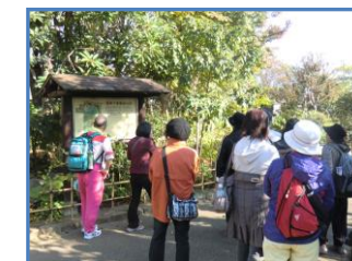
★各自マイペースで荒川土手を散策。（左）柳原千草園も立ち寄りしました。（右）

25年度からは 「フェイスブック・ツイッターまるわかり？サロン」 として生まれ変わります！