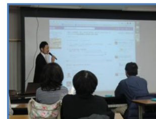
講演形式でも行いました。※詳細は5ページに掲載（右）