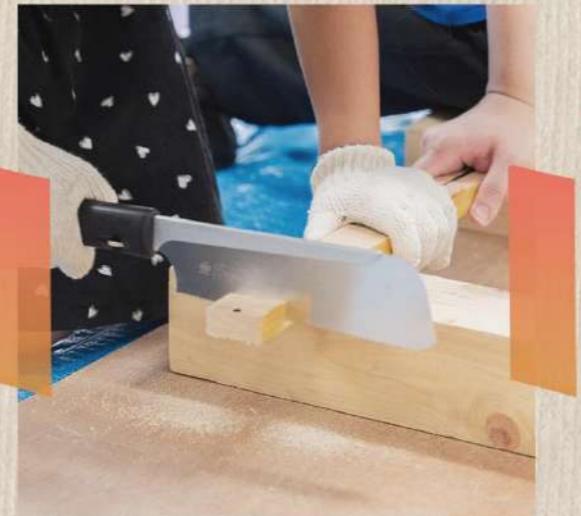
8/5(土) おしごとらんど「こども工務店でお家を建てよう」