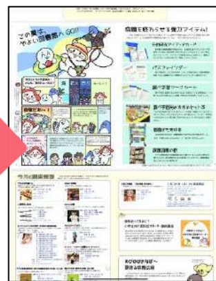
見やすい大きさに拡大して見てね！