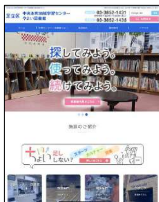
中央本町地域学習センターのホームページにアクセス！