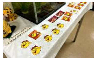
↑窓口のちゅおシールの様子 子どもたちが来館する時間はすぐに無くなってしまいます。

中央本町センター2階窓口にて無料配布していた「ちゅおシール」をご存知でしょうか？マスコットキャラクター「ちゅお」が季節に合わせて衣装チェンジするシールで、子どもたちに大人気でした。長期休館に伴い配布もできなくなってしまいましたが、今回はこれまで配布してきたちゅおシールの一部をご紹介しますと思います。