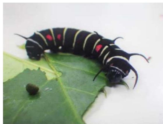
↑毒のあるホウライカガミの葉を食す オオゴマダラの幼虫