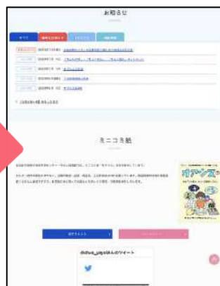
下にスクロールするとミニコミのコーナーがあります！