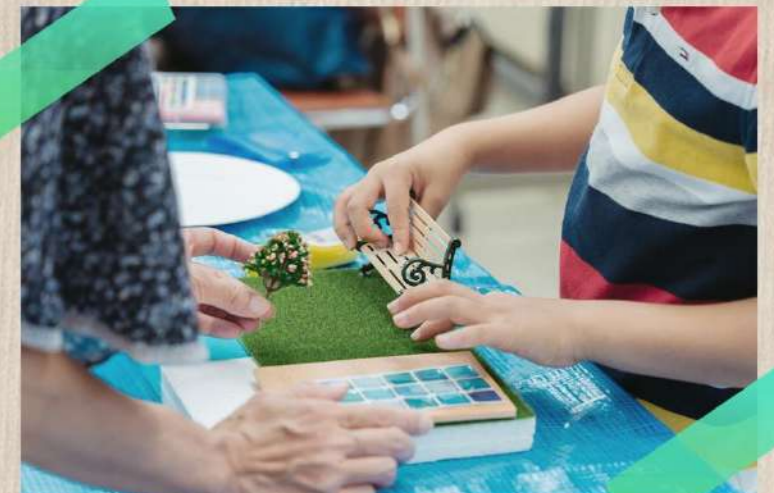
8/5(土) おしごとらんど「こども工務店でお庭をつくろう」