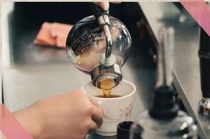
7/26(水) カフェテラス絵瑠座でカフェ店員①