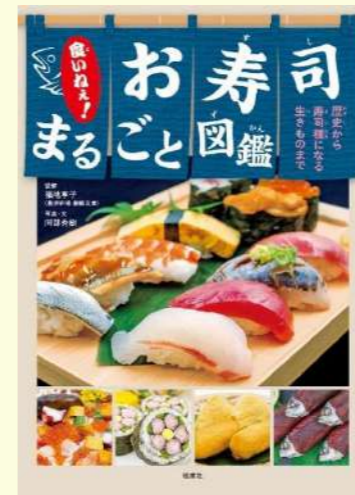
『食いねえ! お寿司まるごと図鑑』 阿部秀樹/写真・文 福地享子/監修 偕成社