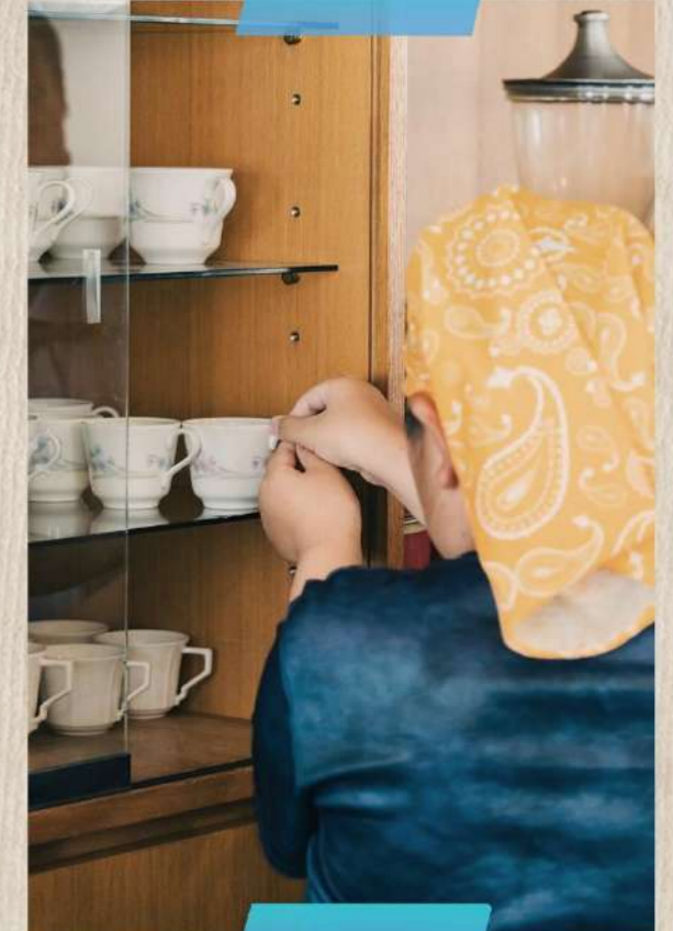
7/26(水) カフェテラス絵瑠座でカフェ店員②