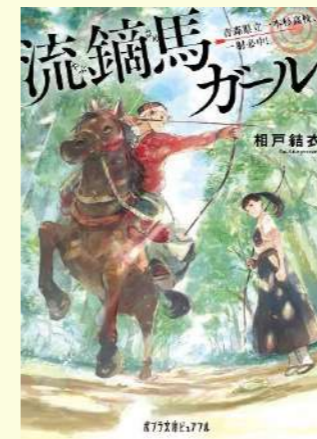
『流鎗馬ガール!』 相戸結衣/著 ポプラ社