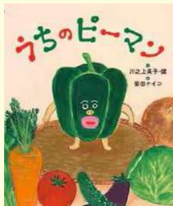
『うちのピーマン』 川之上 英子・川之上 健/文 柴田 ケイコ/絵 アリス館

食べられたくないピーマンと、食べたいお母さんの戦いの結果は、果たしてどうなるのでしょうか?