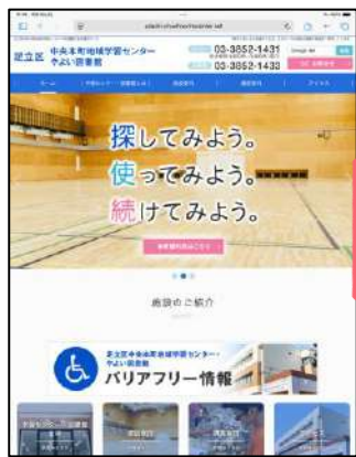
中央本町地域学習センターのホームページにアクセス!