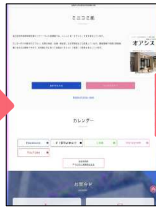
下にスクロールするとミニコミのコーナーがあります!