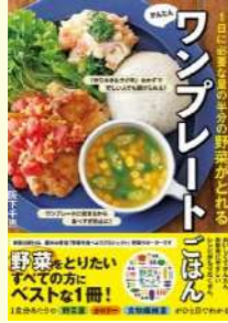
『1日に必要な量の半分の野菜がとれるかんたんワンプレートごはん』 阪下 千恵/著 新星出版社

本書では、冷蔵で2、3日間保存できる「作りおきおかず」と、5分から15分でできる「すぐできるおかず」を紹介。今年度のテーマである「押し麺×ベジ」にふさわしい、具たくさんサラダそばや、オム野菜焼きそばのレシピもあります。ライフスタイルに合わせてレシピを使い分け、無理なく毎日の食卓に野菜を増やしていきましょう!