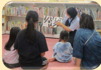
【親子おはなし会 やさい】 日時：6/10(水) 午後3時30分～4時