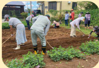
【大人の農業体験 「無農薬野菜作り秋冬編」(5日制)】 ★6/26(金)から募集開始！ 詳しくは5ページをご確認ください

また、やよい図書館では6月の食育月間に併せ、子どもたちの野菜への関心を高める「親子おはなし会 やさい」を開催します。