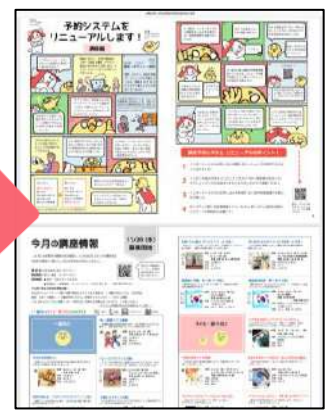
見やすい大きさに拡大して見てね!