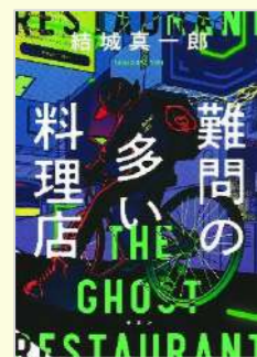
『難問の多い料理店』 結城 真一郎/著 集英社

ふわ玉豆苗スープ事件、オニオントマトスープ事件、具たくさんユッケジャンスープ事件など、数々の難問をオーナーシェフが華麗に解決する短編集です。